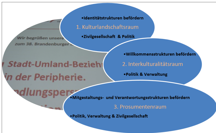
Grafik: Soziale Referenzräume ländlicher Kulturpolitik.

6 Philipp Oswalt: »Der ländliche Raum ist kein Baum: Von den zentralen Orten zur Cloud«, in: Kerstin Faber/ Philipp Oswalt: Raumpioniere in ländlichen Regionen. Neue Wege der Daseinsvorsorge, Dessau 2013, S. 6–17, 14.