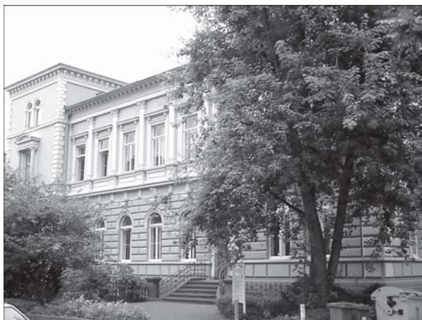
Sitz des Instituts für Kulturpolitik: das »Haus der Kultur« in Bonn

die andere Institute, die nicht über ein solches Netz verfügen, sich erst mühsam erarbeiten müssen. Andererseits kann die Kulturpolitische Gesellschaft in ihrer Meinungs- und Willensbildung auf einen Bestand aufbereiteten Wissens zurückgreifen.