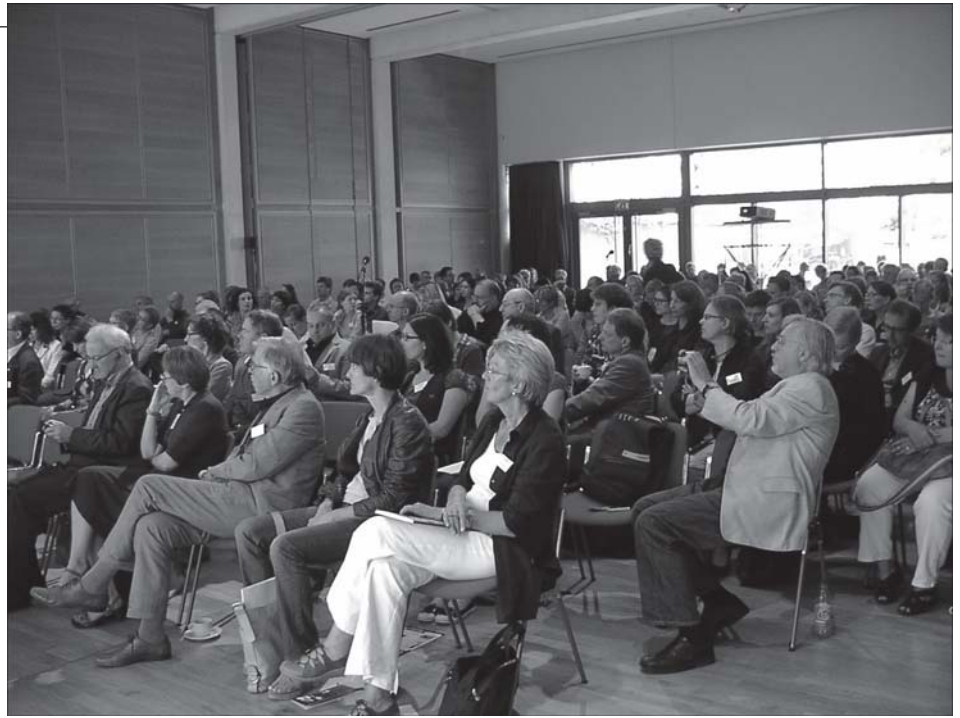
Blick ins Plenum

Um es bildhaft zu sagen: Irgendwie müsste man den Schaum in Wasser verwandeln, aber wie? Es wird nicht möglich sein – das ist mein erster Einwand gegen das Argument von Habermas. Mein zweiter Einwand lautet: Es wäre auch gar nicht wünschenswert. Öffentlichkeitsstrukturen im virtuellen Raum, wie Habermas sie fordert, würden das emanzipatorische Potenzial des digitalen Zeitalters nicht freisetzen, sondern zerstören. Wir verfügen über diese Öffentlichkeitsstrukturen ja bereits in der physischen Welt: Parteien, Parlamente, Bürokratien, Fernsehen, Printmedien, Verbände und Wirtschaft. Sie tun bereits das zur Genüge, was Habermas sich auch im Netz wünscht: Sie selektieren, redigieren, synthetisieren, zentralisieren. Der Vertrauensvorschuss, den sie dabei in Anspruch neh-