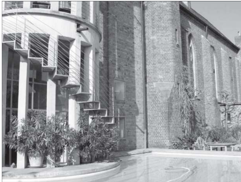
Die Kirche Hl. Drei Könige in Köln-Rondorf wurde zum Wohnhaus mit Swimmingpool und Architekturbüro umgenutzt

Aber steckt hinter den Protesten der Christen gegen den Moscheebau nicht eine tiefer sitzende Angst, Wertvolles, Selbstverständliches, geschichtlich Gewordenes zu verlieren, die Angst, eine als sicher geglaubte